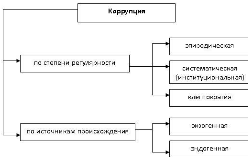
Схема 1. Классификация коррупции

Классификацию коррупции можно представить в виде следующей схемы (см. схему 1[1]).