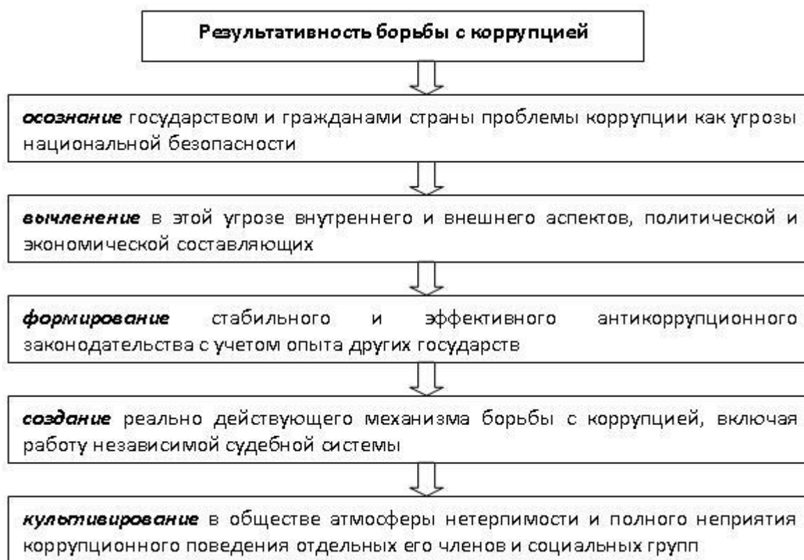
Схема 2. «Цепочка результативности» борьбы с коррупцией

Школьное образование также должно внести свой вклад в создание антикоррупционной атмосферы в обществе, в формирование антикоррупционной устойчивости личности.